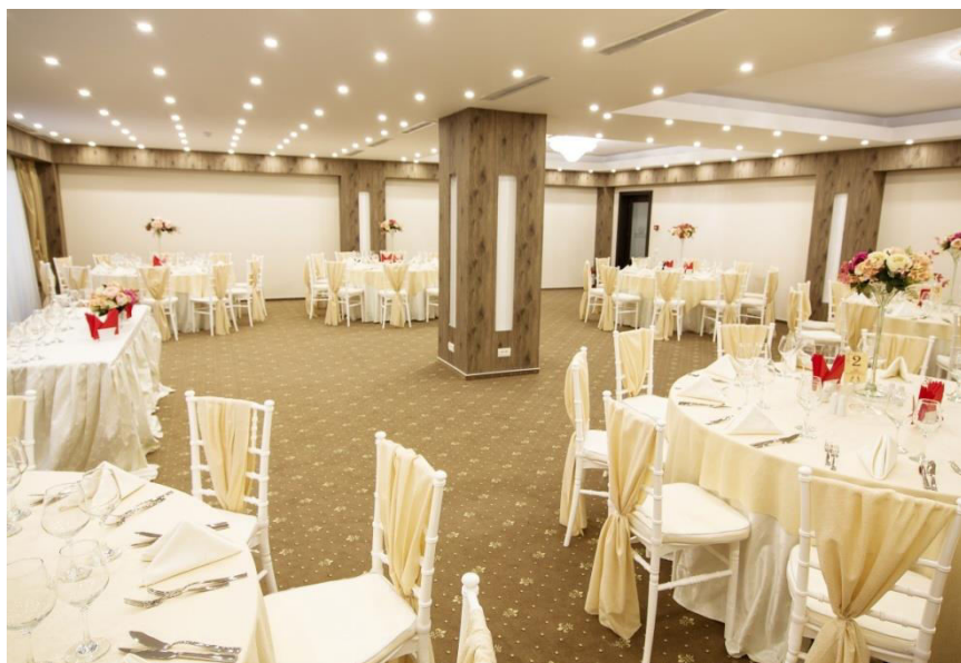
SALON COSMOPOLITAN capacitate 40 - 60 pers.