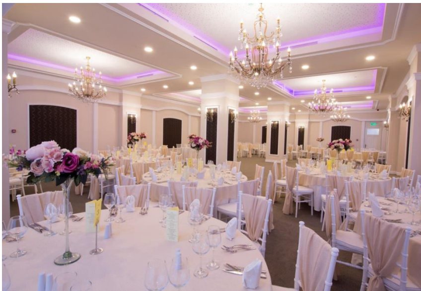
SALON IMPERIAL capacitate 70 - 150 pers.